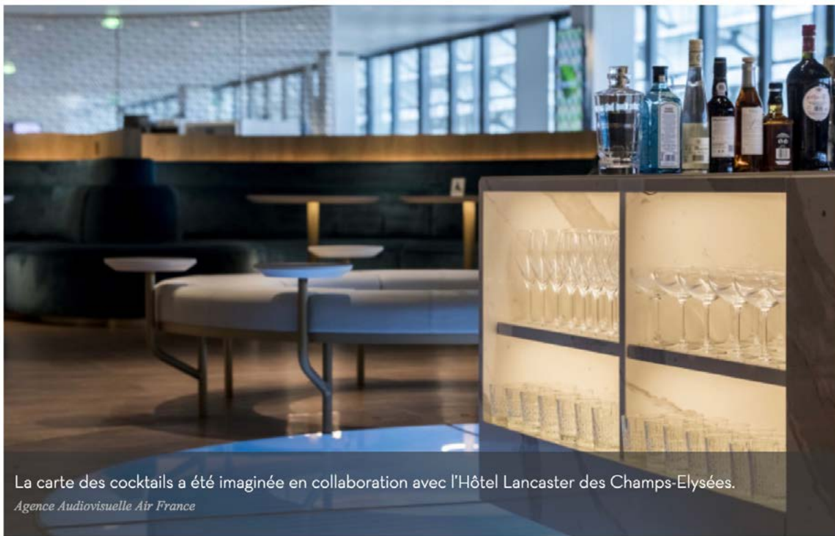
La carte des cocktails a été imaginée en collaboration avec l'Hôtel Lancaster des Champs-Élysées.

Après la canopée de Noé Duchaufour-Lawrance, imaginée en 2012 pour le lounge du hall M, le projet du designer vise une fois de plus à matérialiser la stratégie de montée en gamme de la compagnie aérienne. Les récentes expériences culinaires et bien-être, proposées depuis le début de l'année et pensées par les architectes de Brandimage, s'organisent ainsi autour d'un nouveau centre névralgique, chargé de retranscrire le meilleur de l'art de vivre à la française.