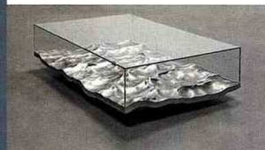
Table basse Coffee table Liquid Aluminium