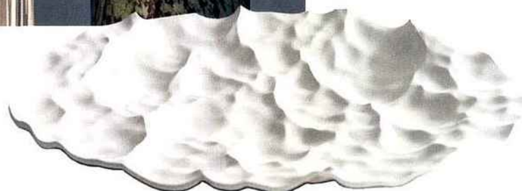
Centre de table Centerpiece Pocket Ocean Mathieu Lehanneur