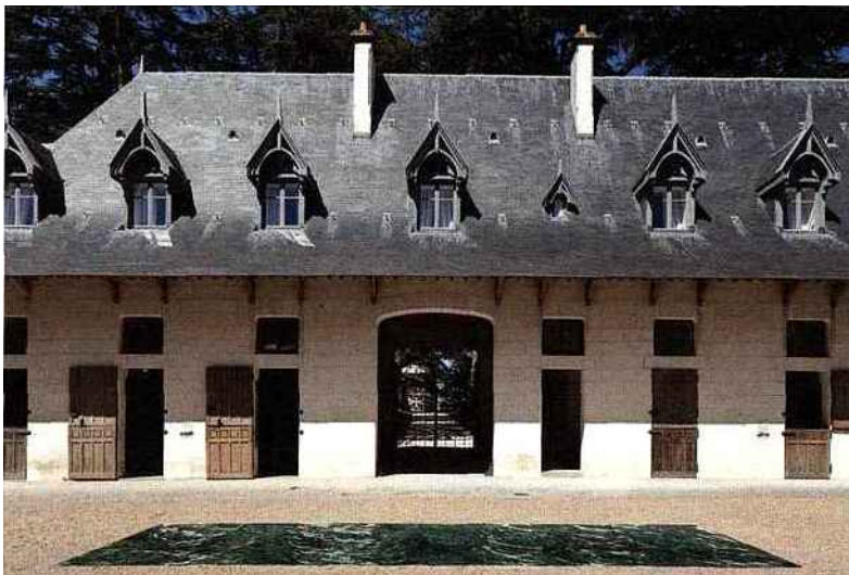
L'installation "Petite Loire", design Mathieu Lehanneur, au Domaine de Chaumont-sur-Loire.